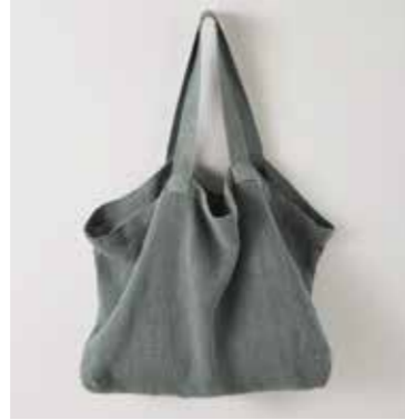
NOMADE XL vert de gris