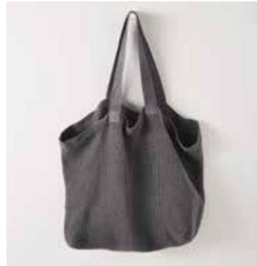
NOMADE XL acier