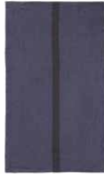
DOUDOU RAYÉ indigo