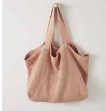
NOMADE XL pétale