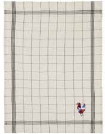
BISTROT lin/noir coq français