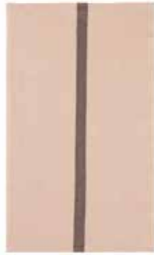
DOUDOU RAYÉ pétale