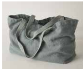
DOUDOU vert de gris