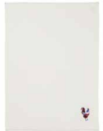
UNI LIN coq français

Tous les tissus présentés dans ce catalogue sont disponibles en rouleaux.