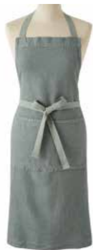
DOUDOU vert de gris