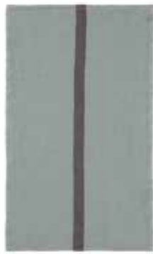
DOUDOU RAYÉ vert de gris