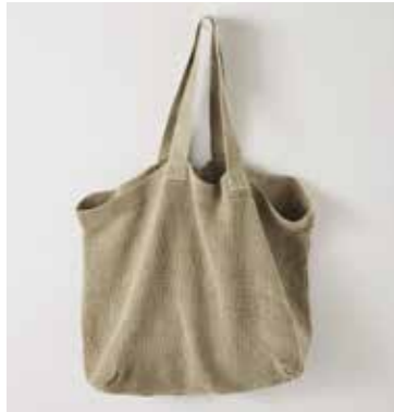
NOMADE XL naturel