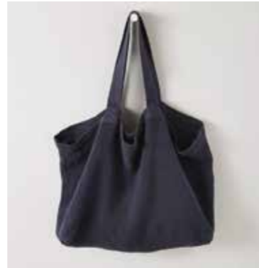
NOMADE XL indigo