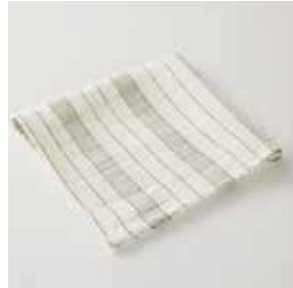
blanc / lin