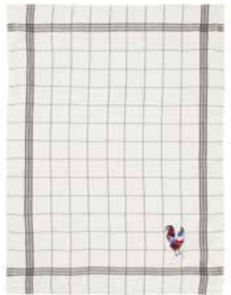
BISTROT noir coq français