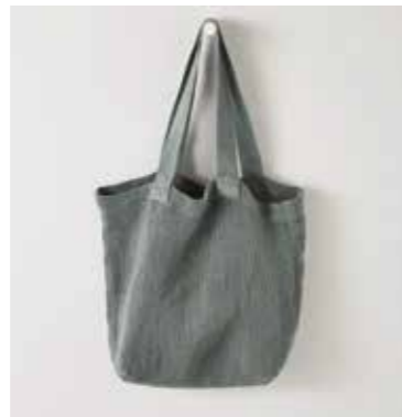
NOMADE vert de gris